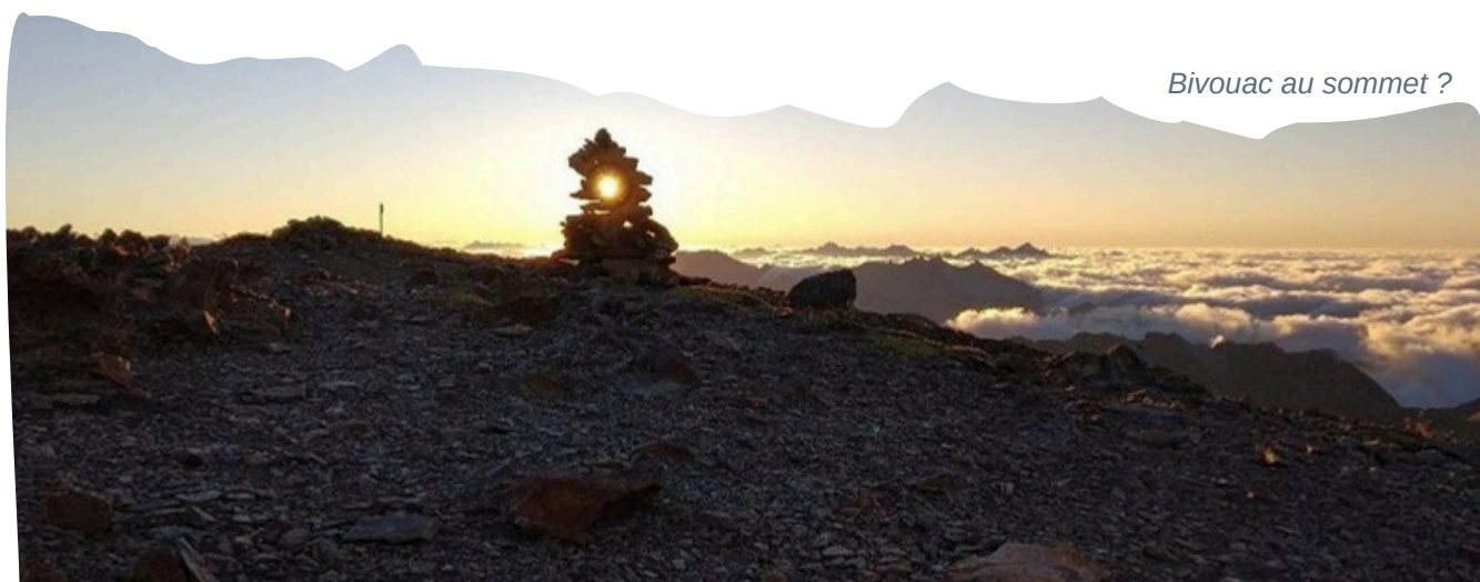
Bivouac au sommet ?